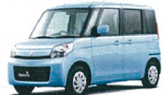
スズキ スペーシア DBA-MK32S

リース期間5年 月々お支払い例 (税別) ファイナンスリース ¥22,000 メンテナンスリース ¥26,000 (車検・整備付き)