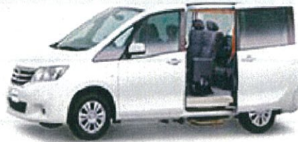
ニッサンセレナアンシャント 20S DBA-C26

リース期間5年 月々お支払い例 (税別) ファイナンスリース ¥41,600 メンテナンスリース ¥47,300 (車検・整備付き)