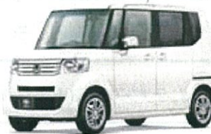
ホンダ NBOX DBA-JF1

リース期間5年 月々お支払い例 (税別) ファイナンスリース ¥12,700 メンテナンスリース ¥16,200 (車検・整備付き)