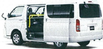
トヨタ ハイエースワゴン 送迎仕様車 ロングワイドミドルルーフ CBA-TRH214W

リース期間5年 月々お支払い例 (税別) ファイナンスリース ¥41,600 メンテナンスリース ¥47,300 (車検・整備付き)