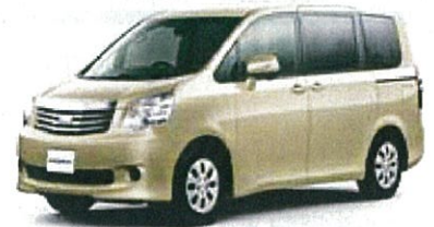
トヨタ ノアX 送迎仕様 ZRR70G-APXEP

リース期間5年 月々お支払い例 (税別) ファイナンスリース ¥36,800 メンテナンスリース ¥42,100 (車検・整備付き)