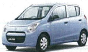
スズキアルト F DBA-HA25S

リース期間5年 月々お支払い例 (税別) ファイナンスリース ¥12,700 メンテナンスリース ¥16,200 (車検・整備付き)