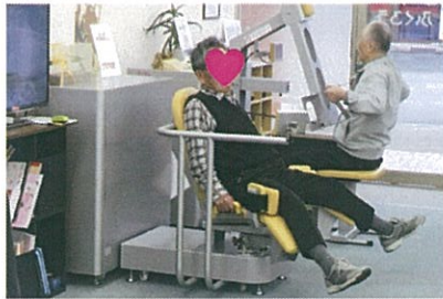
マシントレーニング

マシントレーニング、ルームナンナー、バイクなどの機器を使用した機能訓練から棒体操、立位訓練等の身体機能訓練と脳トレや口腔体操などさまざまな機能訓練を行います。